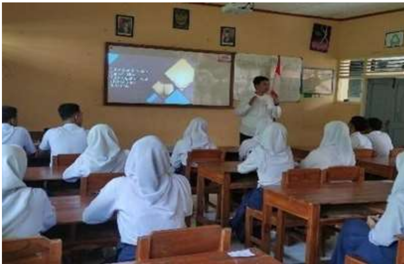
Gambar 3. Aktivitas peserta didik dalam pengamatan lapangan siklus II

Siklus II dirancang sebagai penyempurnaan dari kelemahan siklus I, dengan memperkuat aspek pemodelan teks, eksplorasi lingkungan, serta pembimbingan penggunaan unsur kebahasaan. Aktivitas somatis diperluas melalui pengamatan langsung ke lingkungan sekitar sekolah, sedangkan aspek intelektual ditingkatkan melalui latihan mengembangkan alur dan pesan moral.