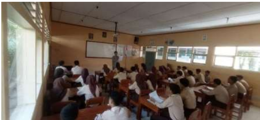
Gambar 2. Dokumentasi kegiatan pembelajaran dengan pendekatan SAVI siklus I

Pada siklus I, guru memperkenalkan model SAVI melalui kegiatan menonton video, diskusi kelompok, dan latihan menulis berdasarkan hasil pengamatan. Aktivitas ini bertujuan merangsang kesadaran siswa terhadap nilai simpati, empati, dan kepedulian dalam kehidupan sehari-hari sebagai bahan cerita.